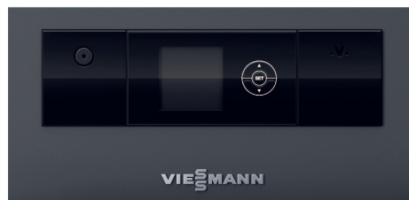
Regulator Ecotronic 100 z podświetlanym wyświetlaczem do prostej i intuicyjnej obsługi