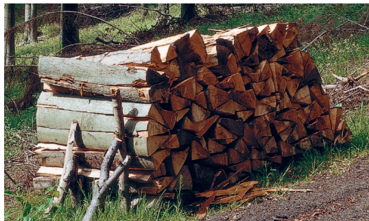
Ogrzewanie drewnem – najbardziej naturalnym paliwem na świecie

Kocioł Vitoligno 150-S pracuje z modulacją mocy i dopasowuje się bezstopniowo do aktualnego zapotrzebowania na ciepło. Układ regulacji spalania z sondą lambda i czujnikiem temperatury spalin rejestruje zawartość tlenu w spalinach i temperaturę spalin, dbając o niskie emisje substancji szkodliwych i wysoką sprawność kotła, do nawet 93,1%. W ten sposób Vitoligno 150-S oszczędnie pozyskuje z polan drewna użyteczne ciepło.